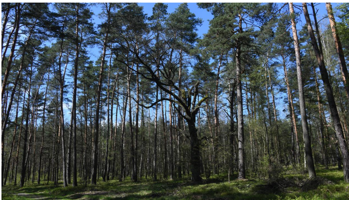
Zbiorowiska borowe