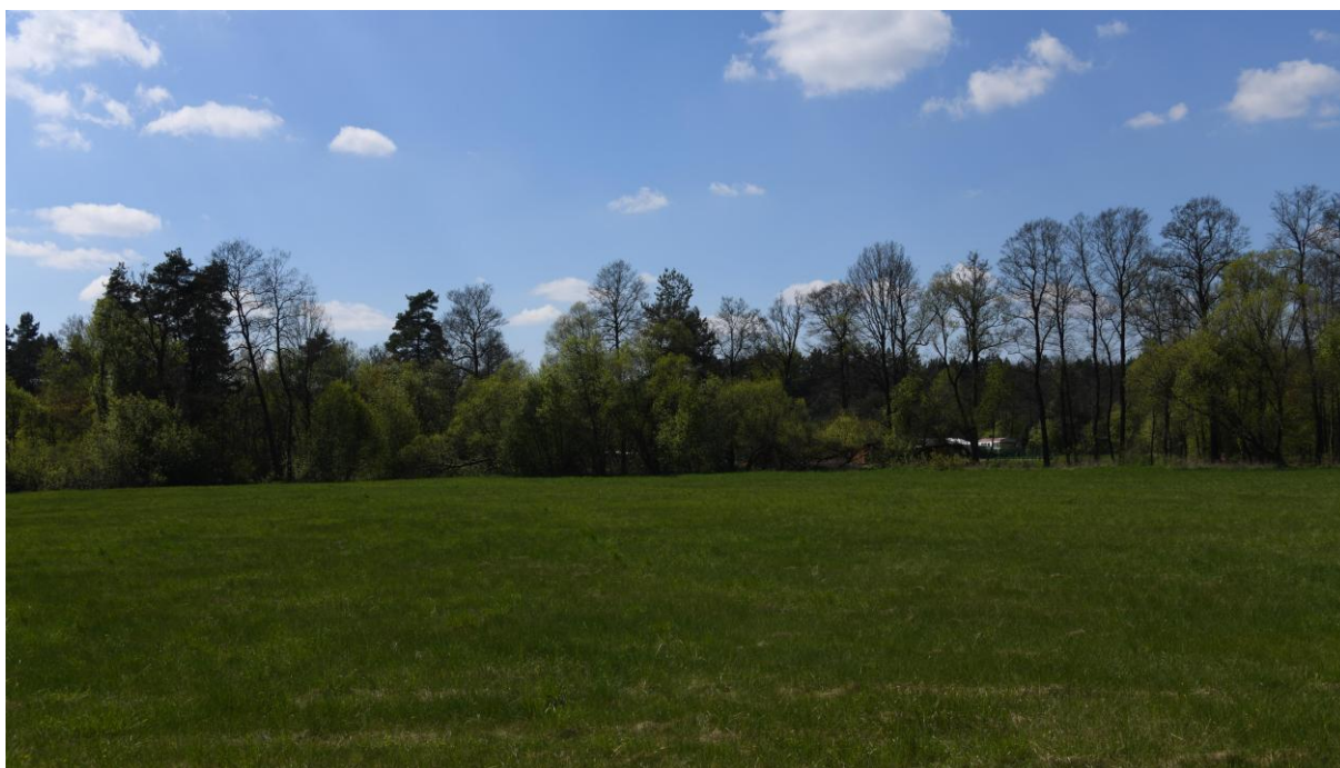
Typowy krajobraz doliny Małej Panwi z dominacją łąki i zadrzewień nadbrzeżnych