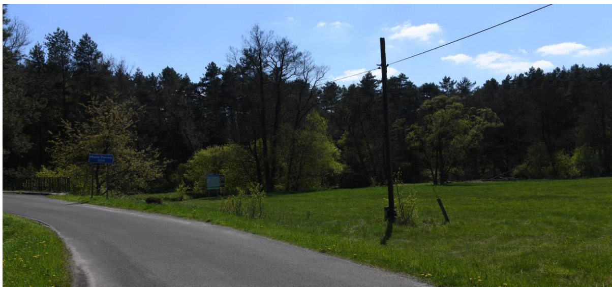
Droga do zabudowań i zadrzewiony brzeg Małej Panwi