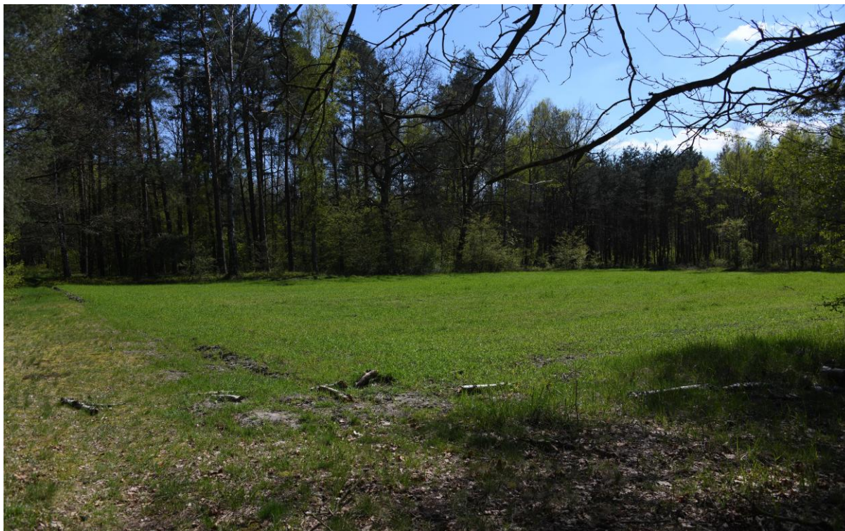
Zbiorowiska łąkowe w dolinie Małej Panwi